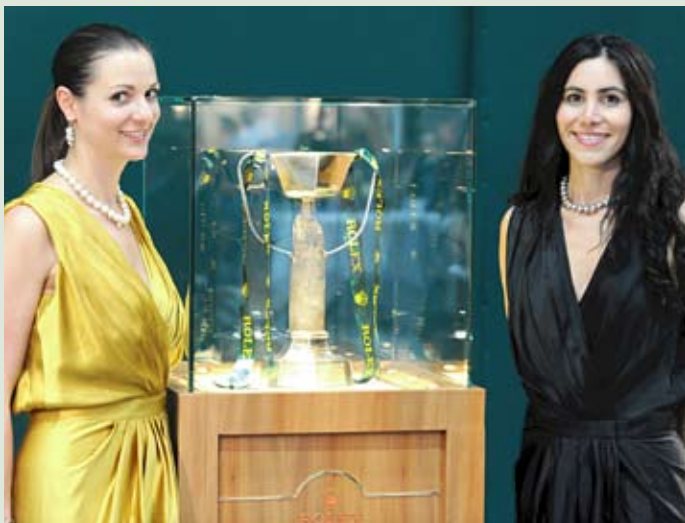
Strahlend: Der Welpokal für den Sieger des Rolex FEI World Cup Final Jumping ist heiß begehrt und hier gut bewacht von den charmanten Hostessen, die jede Siegerehrung der Partner Pferd begleiten.