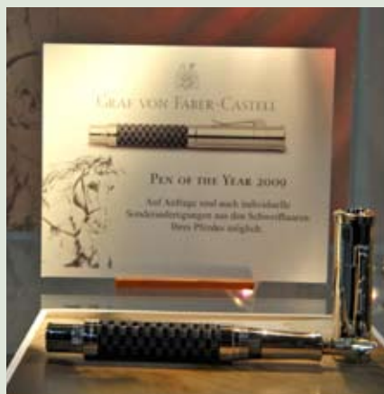
Spezialedition: Ein Füllhalter von Graf v. Faber-Castell aus Rosshaar – in Handwerkskunst vom Schweifhaar auch des eigenen Pferdes möglich.