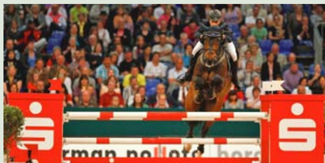
Alles zum Sparkassen-Cup – Großer Preis von Leipzig – auf Seite 5.