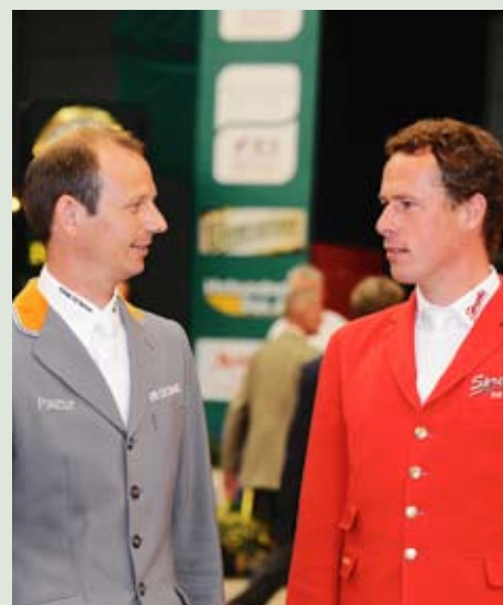
Pole-Position: Marco Kutscher (l.) und Christian Ahlmann (r.) teilen sich nach zwei von drei Wertungen die Führung im Weltcup-Finale.